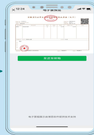
查看电子票据图片