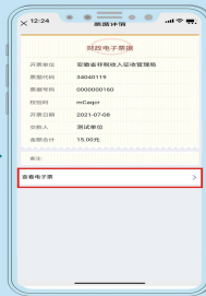
查看电子票据信息