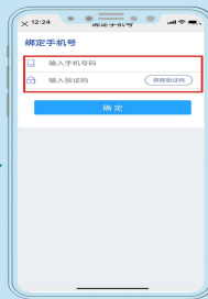
输入手机号及验证码