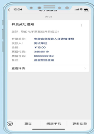
查看个人所有票据